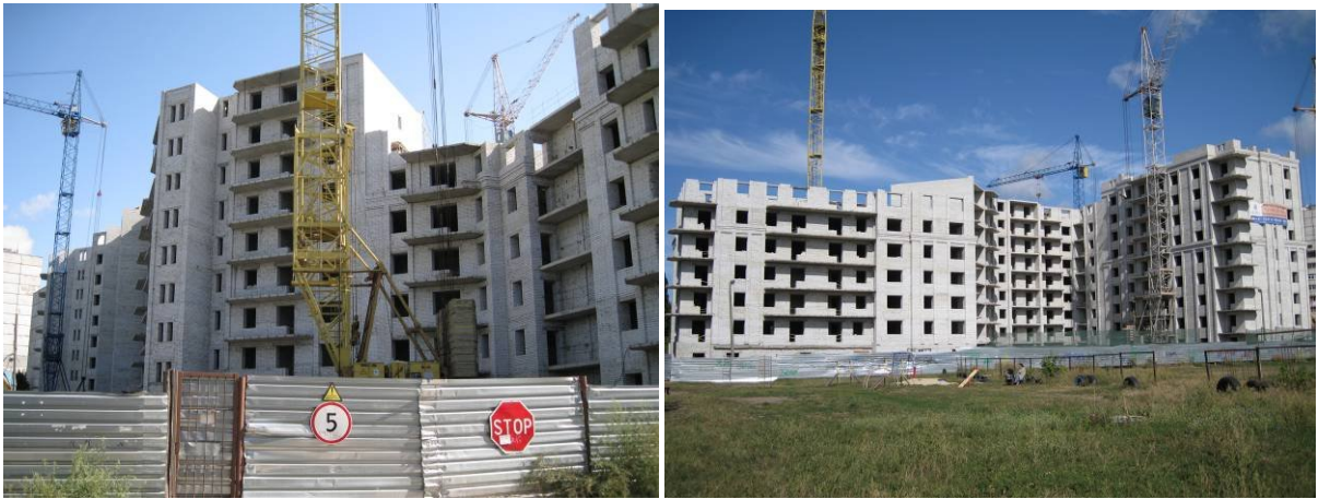
Хід робіт на об'єкті будівництва по пр. Тракторобудівників, в районі буд. 103 А у м. Харкові станом на 21.08.2009 р.