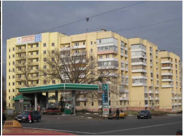
Секція № 6 житлового будинку по пр. Тракторобудівників, 79/42 у м. Харкові