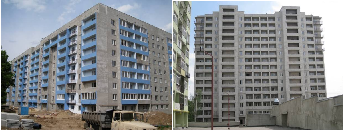
Житлові будинки по пр. Перемоги, 66-Д (буд. №1 та буд.№5) у м. Харкові