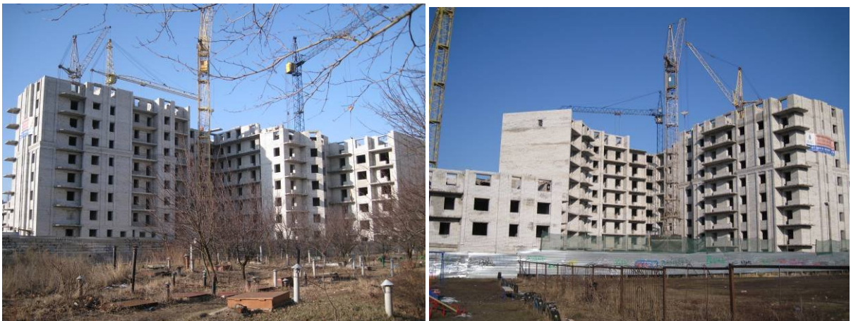
Хід робіт на об'єкті будівництва по пр. Тракторобудівників, в районі буд. 103 А у м. Харкові станом на 20.02.2009 р.