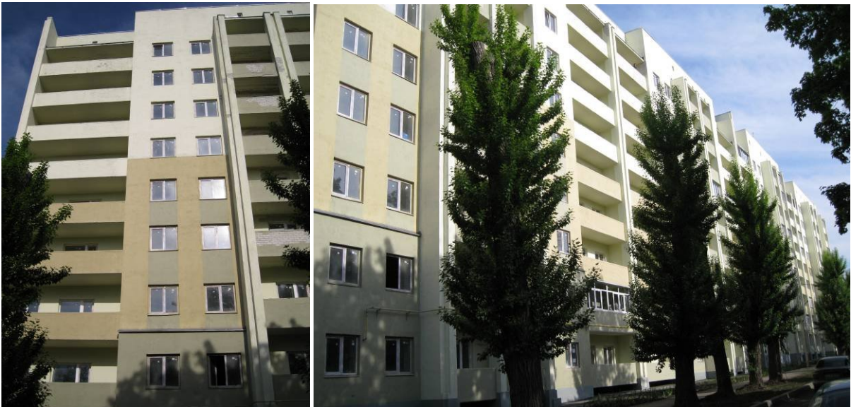
Хід робіт на об'єкті будівництва (секції Є) по Салтівському шосе, 73 у м. Харкові в м. Харкові