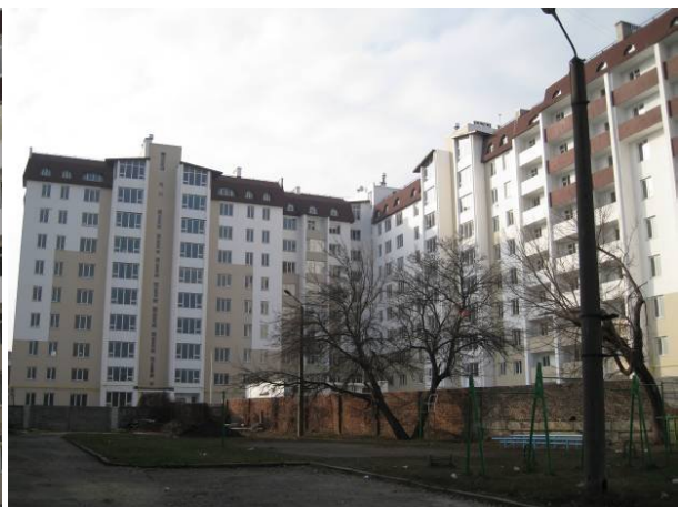
Житлові будинки по пр. Московському, 131 у м. Харкові