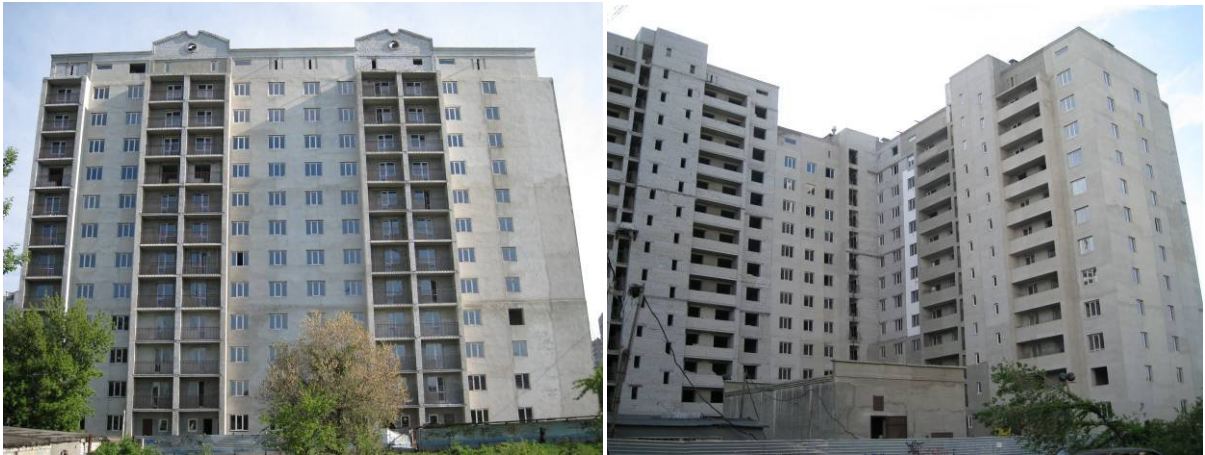
Будівництво житлового будинку по пр. Маршала Жукова-ріг Садового проїзду у м. Харкові