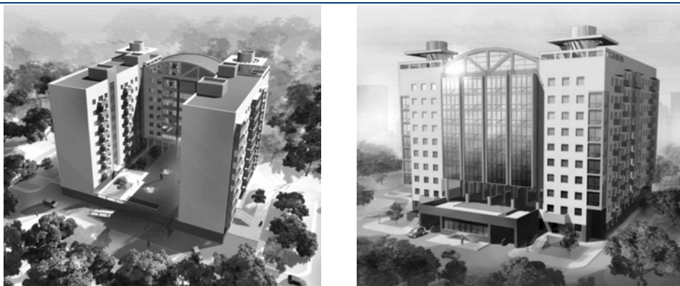
Рисунок 2.2. Макет об'єкта будівництва по вул. Станіславського, 3 у м. Дніпропетровську

Наразі ТОВ ВКФ «Будівел» (на правах Замовника та Інвестора) здійснює реалізацію проекту будівництва торговельно-житлового комплексу «Південний» по вул. Станіславського, 3 у м. Дніпропетровську (Рисунок 2.2).