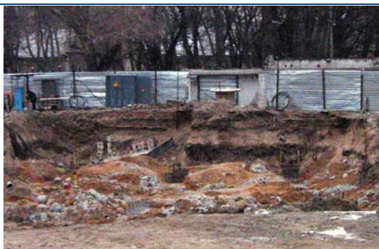
Рисунок 2.3. Хід робіт на об'єкті будівництва по вул. Станіславського, 3 у м. Дніпропетровську станом на 14.02.2008 р.

Орієнтовний строк закінчення будівництва та введення будинку в експлуатацію, згідно з графіком виконання та фінансування, – I квартал 2010 року (Додаток № 4).