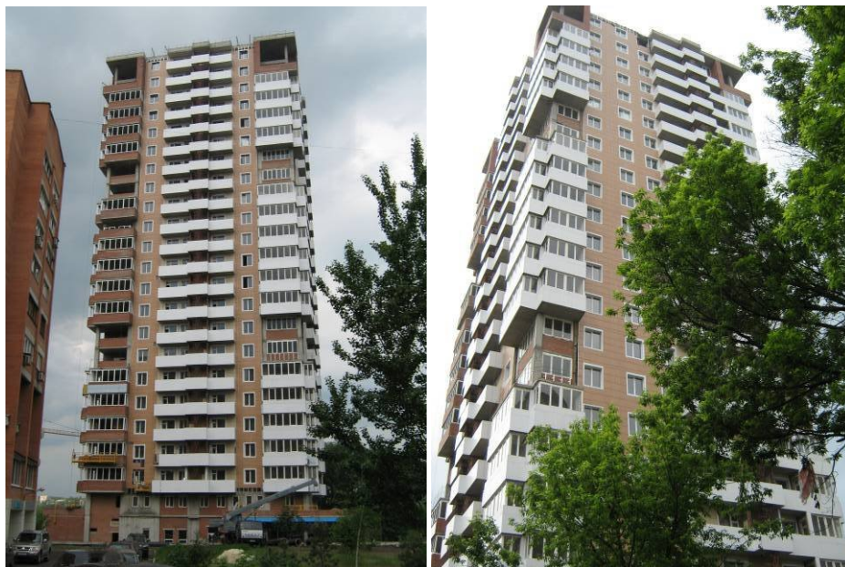
Будівництво житлового будинку №1 по пр. Панфілова у м. Донецьку станом на 29.05.2009 р.