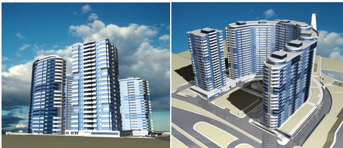
Макет житлового комплексу з п'яти будинків по пр. Панфілова у м. Донецьку