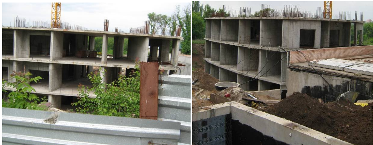
Будівництво житлового будинку №2 по пр. Панфілова у м. Донецьку станом на 29.05.2009 р.