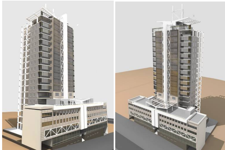
Макет будівлі житлового комплексу по вул. Шевченка у м. Дніпропетровську