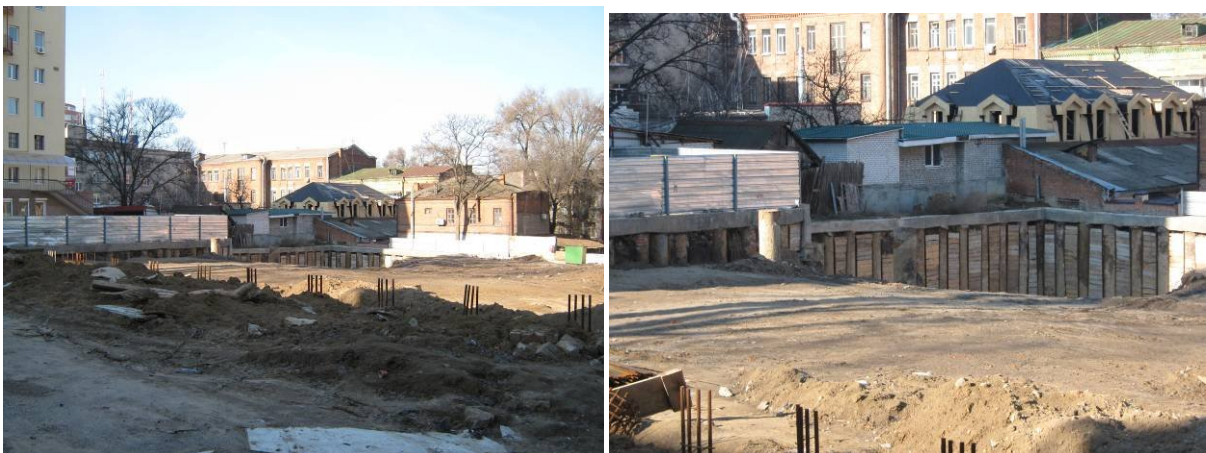
Хід робіт на об'єкті будівництва по вул. Шевченка у м. Дніпропетровську станом на 20.02.2009 р.