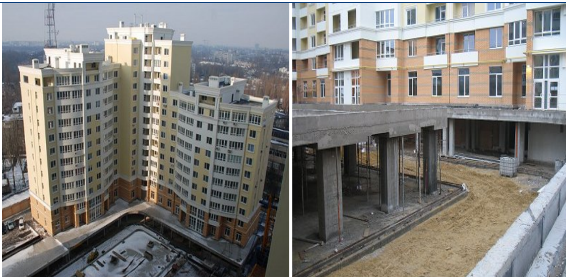
Хід будівництва житлового комплексу вул. Армійській, 11 станом на кінець січня 2011 року