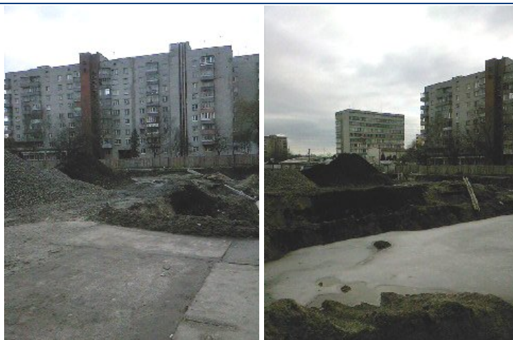
Хід будівництва багатоповерхового житлового будинку з вбудованими офісними приміщеннями та підземними автостоянками на пр. В. Чорновола – вул. П. Панча в м. Львові станом на середину лютого 2009 року