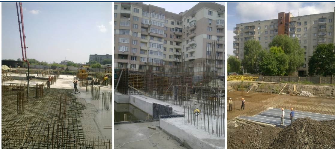
Хід будівництва багатоповерхового житлового будинку з вбудованими офісними приміщеннями та підземними автостоянками на пр. В. Чорновола – вул. П. Панча в м. Львові станом на липень 2010 року