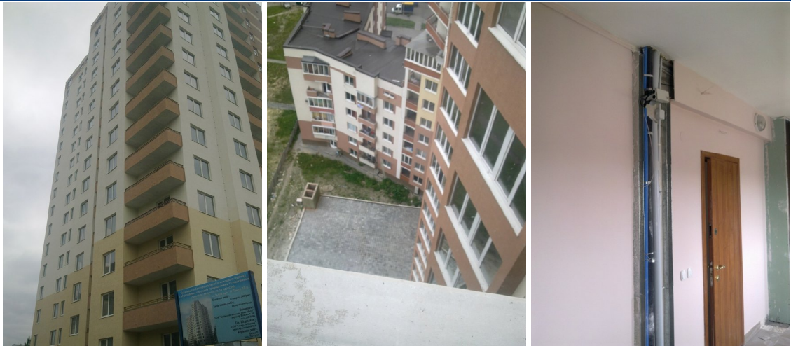
Хід будівництва багатоповерхового житлового будинку з вбудованими офісними приміщеннями та підземними автостоянками по вул. Панча, 18-б у м. Львові станом на червень 2010 року