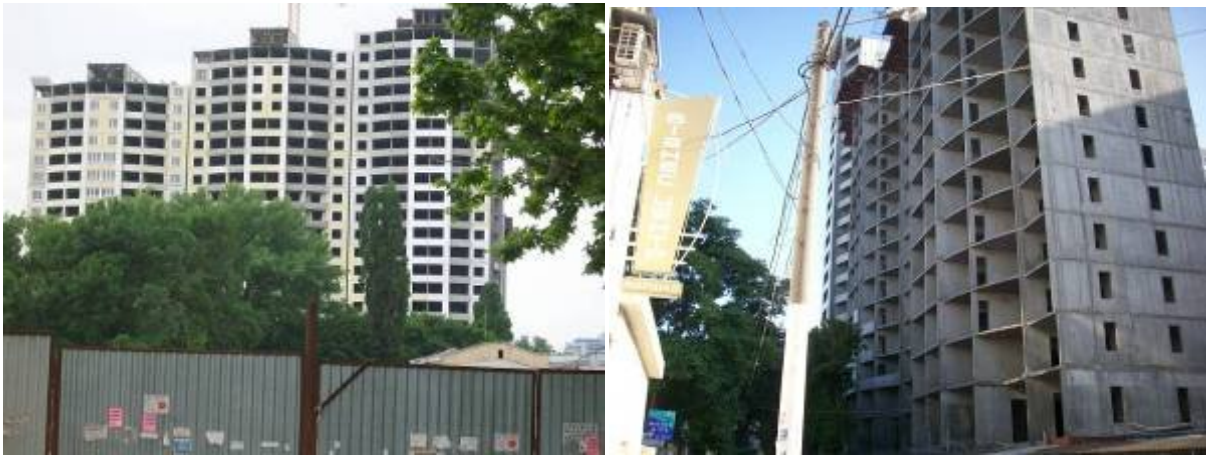
Будівництво житлового комплексу вул. Арміській, 11 станом на 29.05.2009 р. та станом на 08.09.2009 р.