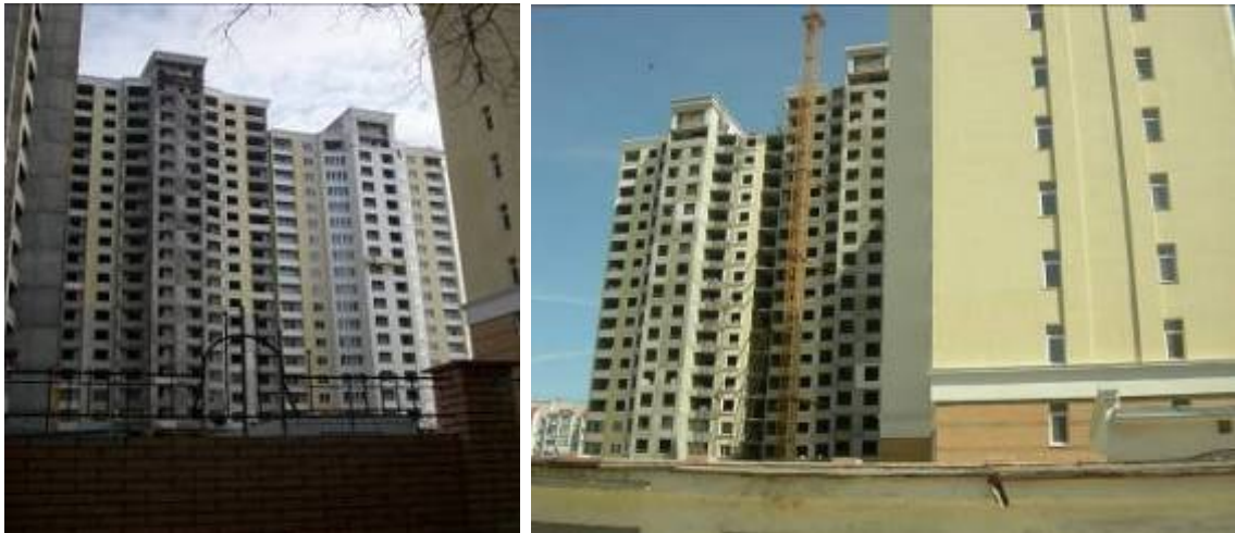
Будівництво житлового комплексу вул. Арміській, 11 станом на 04.03.2010 р. та на кінець серпня 2010 р.