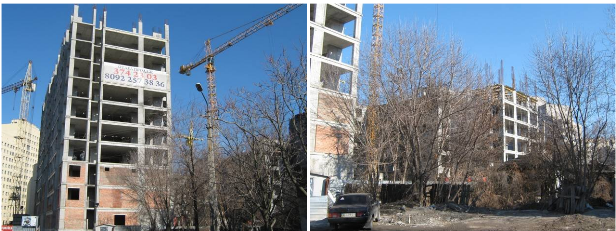
Хід робіт на об'єкті будівництва по пров. Ламаному в м. Дніпропетровську станом на 20.02.2009 р.