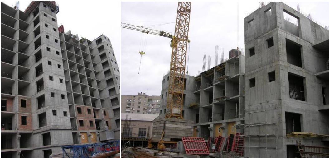
Хід робіт на об'єкті будівництва по пров. Ламаному в м. Дніпропетровську станом на 21.11.2008 р.