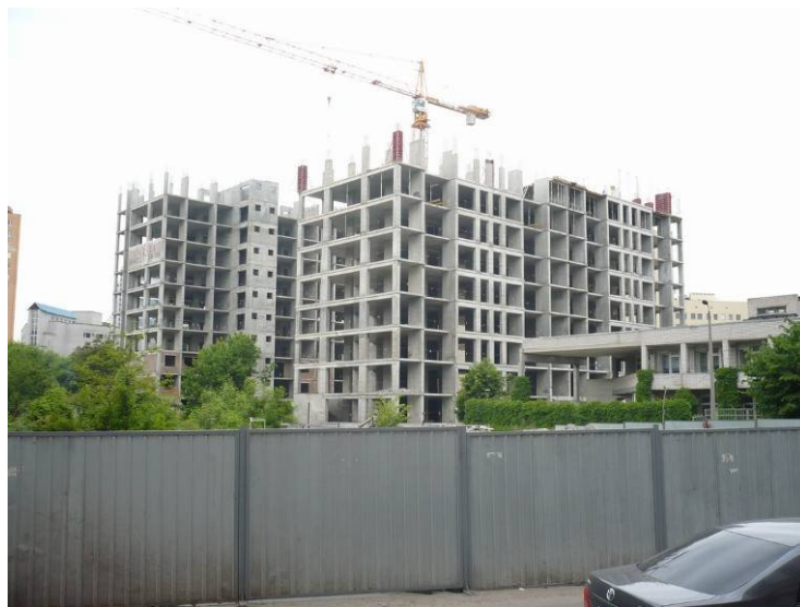
Хід робіт на об'єкті будівництва по пров. Ламаному в м. Дніпропетровську станом на 10.06.2009 р.