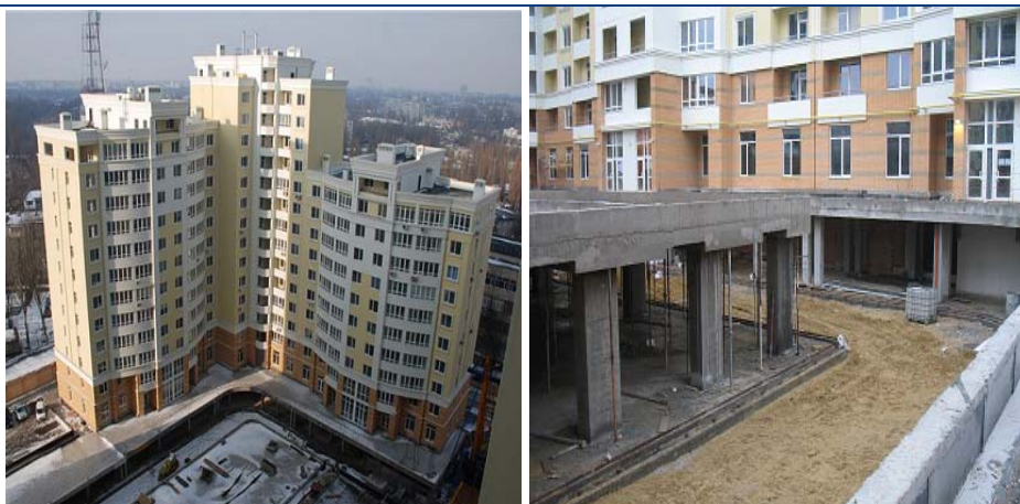
Хід будівництва житлового комплексу вул. Армійській, 11 станом на кінець січня 2011 року