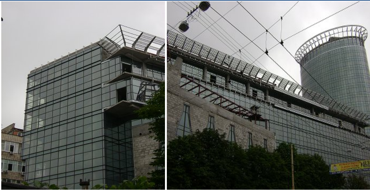
Хід робіт на об'єкті будівництва по вул. Мельникова, 2/10, станом на 24.06.2010 р.