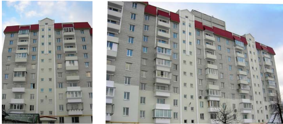
Рисунок 2.4. Стан об'єкта будівництва по вул. Червоноармійській, 157 у м. Черкасах на 29.01.2008 р.