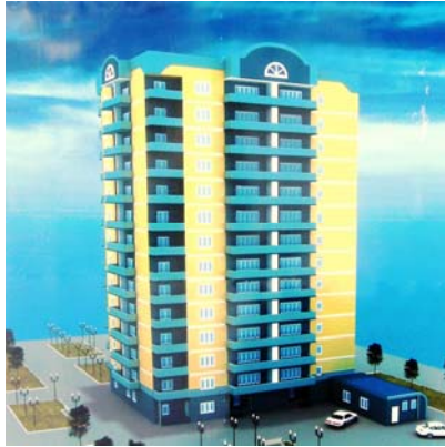
Рисунок 2.2. Макет будівлі житлового будинку по вул. Б. Вишневецького, 70 у м. Черкасах

прибудованими приміщеннями (I черга будівництва) по вул. Б. Вишневецького, 70 (буд. номер №78) у м. Черкасах (Рисунок 2.2).