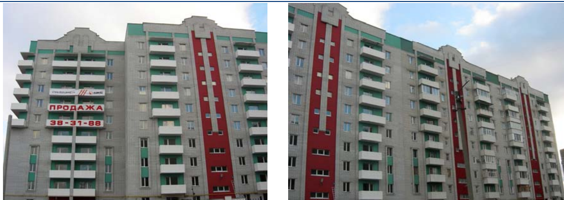
Рисунок 2.5. Стан об'єкта будівництва по вул. Сумгайтській, 19/1 у м. Черкасах на 29.01.2008 р.

У ІV кварталі 2007 року було завершено реалізацію проекту будівництва об'єкта по вул. Сумгайтській, 19/1 у м. Черкасах загальною житловою площею 4 808,1 кв. м згідно з Актом Державної приймальної комісії про прийняття в експлуатацію закінченого будівництвом об'єкта від 15.12.2007 р., затвердженого Рішенням Черкаської міської ради № 49 від 22.01.2008 р. Будівельно-монтажні роботи здійснено протягом липня 2005 року – грудня 2007 року.