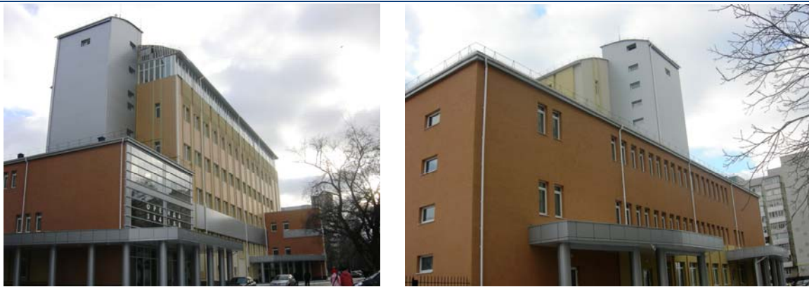
Рисунок 2.6. Стан об'єкта будівництва по вул. Паризької Комуни, 7 у м. Черкасах на 29.01.2008 р.