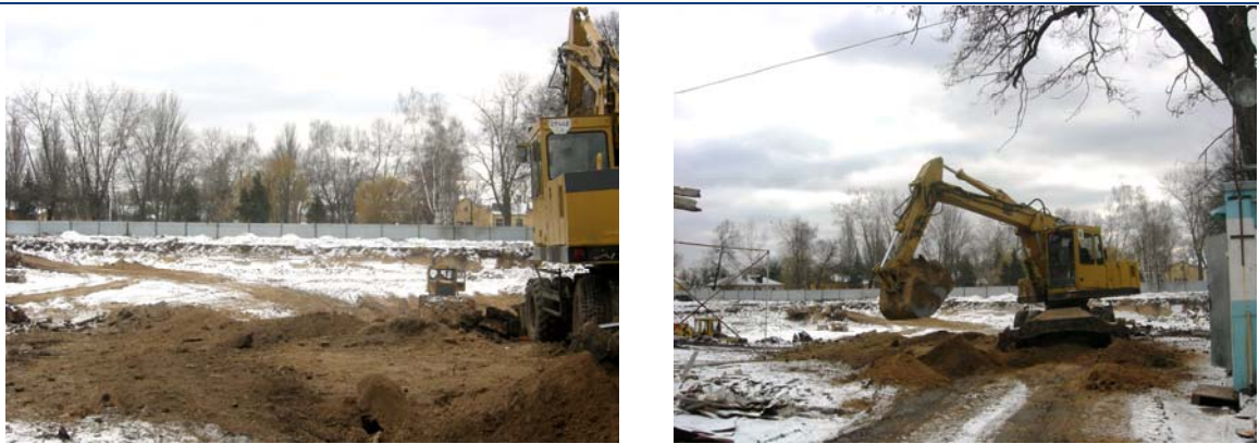
Рисунок 2.3. Хід робіт на об'єкті будівництва по вул. Б. Вишневецького, 70 (буд. номер №78) у м. Черкасах станом на 29.01.2008 р.

Станом на 29.01.2008 р. на об'єкті виконані такі роботи: розроблено та узгоджено проектно-кошторисну документацію; розчищено, підготовлено та огорожено будівельний майданчик; проведено геодезичні зйомки та випробування ґрунту; виготовлено та привезено конструктивні каркасні залізобетонні елементи для будівництва житлового будинку. Наразі на об'єкті будівництва виконуються роботи з улаштування котловану. Орієнтовний строк закінчення будівництва та введення будинку в експлуатацію, згідно з графіком виконання та фінансування, – II квартал 2010 року (Додаток № 4).