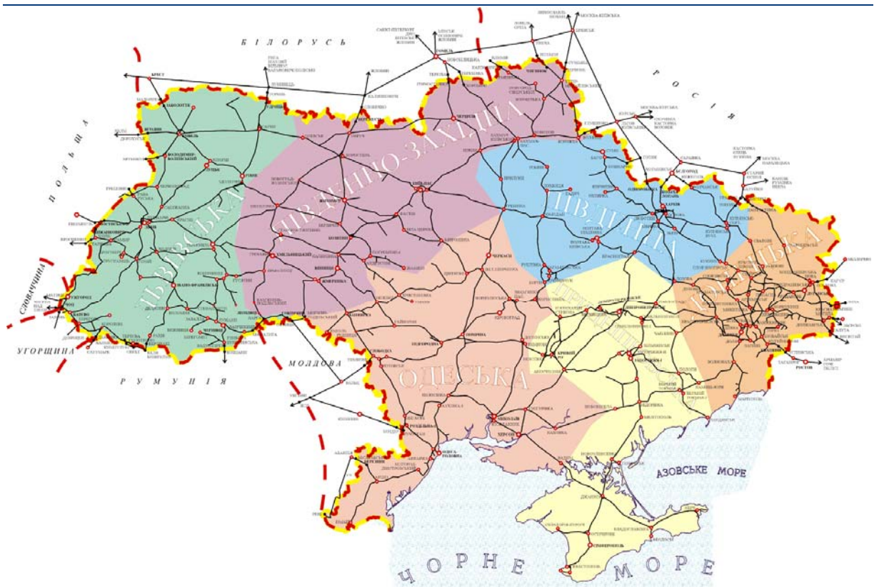
Рисунок 1. Карта залізниць України

Південна залізниця засновано на державній власності, входить до сфери управління Міністерства транспорту та зв'язку України і підпорядкована Державній адміністрації залізничного транспорту України (далі – «Укрзалізниця»), яку було створено згідно з Постановою КМУ № 356 від 14.12.1991 р. Відповідно до зазначеної Постанови у підпорядкуванні «Укрзалізниці» перебувають Донецька, Львівська, Одеська, Південна, Південно-Західна та Придніпровська залізниці (Рисунок 1), а також всі інші розташовані на території України підприємства, установи й організації, що були підпорядковані Міністерству шляхів СРСР. «Укрзалізниця» здійснює централізоване керування процесом перевезень у внутрішньому та міждержавному сполученнях, а також регулює виробничо-господарську діяльність залізниць.