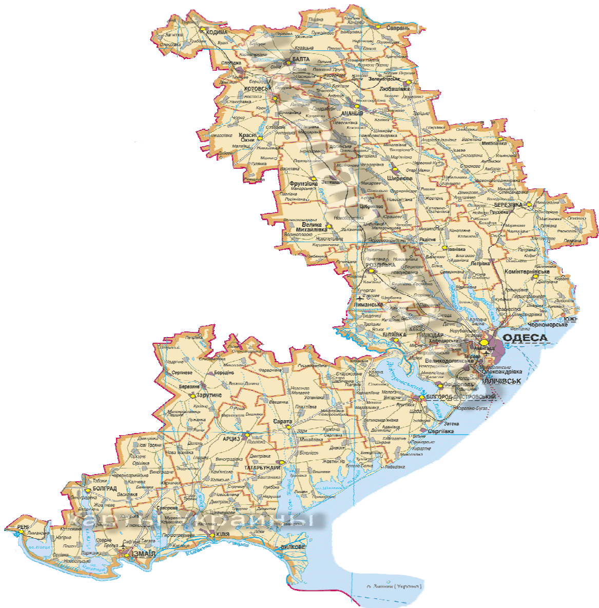
Рисунок 1.1 Карта Одеської області

Місто Одеса - адміністративний центр Одеської області. Одеська область включає 19 міст, з них 7 міст обласного значення, 33 селища міського типу, 23 селища та 1 103 села (Рисунок 1.1)