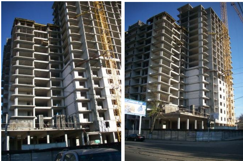
Рисунок 2. Стан будівництва житлового будинку по вул. Прохорівській, 39-41 у м. Одесі, на 26.11.2009 р.