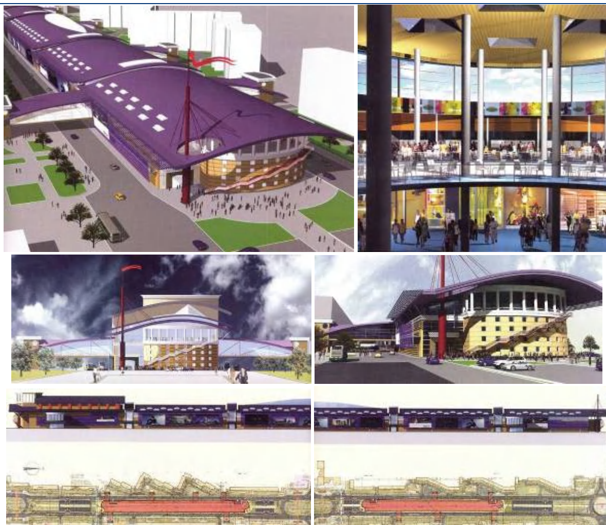
Рисунок Ошибка! Текст указанного стиля в документе отсутствует..4. Макет Торгово-розважального центру «Оболонь»