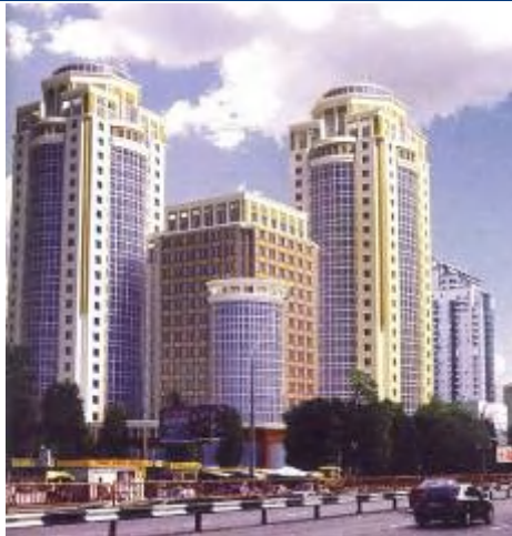
Рисунок Ошибка! Текст указанного стиля в документе отсутствует..3. Макет житлового будинку на пр. Перемоги, 26 у м. Києві