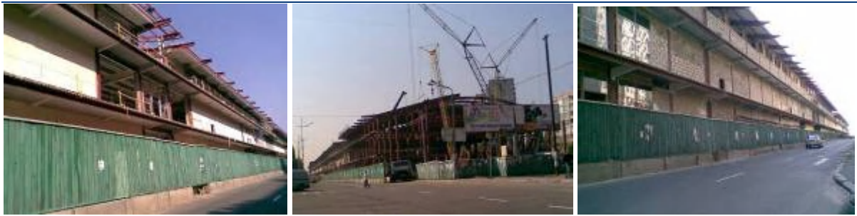
Рисунок Ошибка! Текст указанного стиля в документе отсутствует..5. Хід будівництва торгово-розважального центру «Оболонь» у м. Києві станом на 26.08.2008 р.