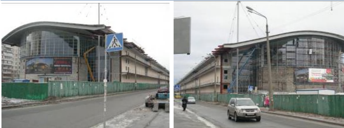
Рисунок Ошибка! Текст указанного стиля в документе отсутствует..6. Хід будівництва торгово-розважального центру «Оболонь» у м. Києві станом на 24.12.2008 р.