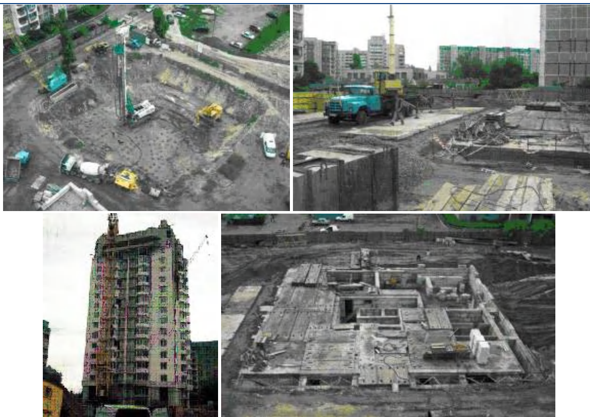
Рисунок Ошибка! Текст указанного стиля в документе отсутствует..8. Хід будівництва житлових будинків по вул. Гагаріна, 41/1 у м. Черкасах (ж/б №5/1 – 2 фото зверху, ж/б №5/2, ж/б №5/3) станом на початок серпня 2008 року