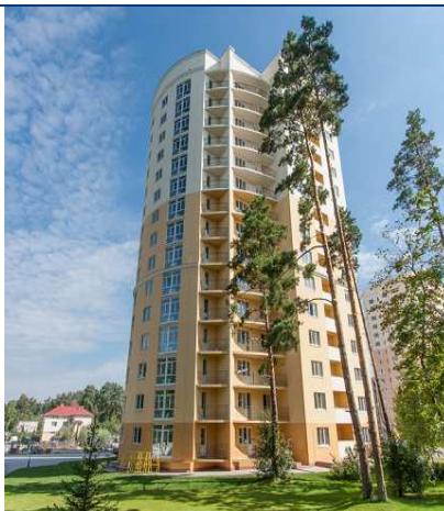
Будинок №8 (II черга) житлового комплексу по вул. Лобановського, 1 у с. Чайці Києво-Святошинського району Київської області станом на кінець серпня 2013 року