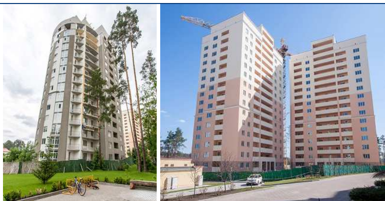
Будівництво житлового комплексу (II черга) по вул. Лобановського, 1 у с. Чайці Києво-Святошинського району Київської області станом на кінець травня 2013 року (зліва направо: будинок №8, будинок №9)