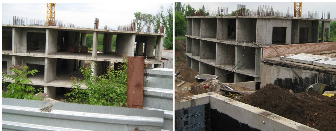
Будівництво житлового будинку №2 по пр. Панфілова у м. Донецьку станом на 29.05.2009 р.