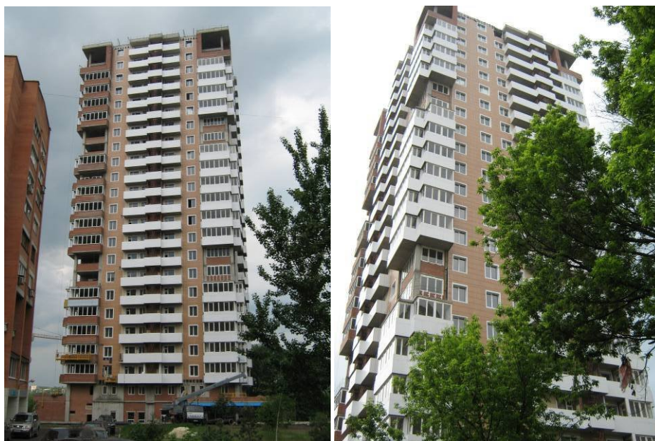
Будівництво житлового будинку №1 по пр. Панфілова у м. Донецьку станом на 29.05.2009 р.