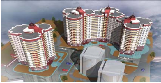
Макет житлового комплексу та ділянка під будівництво (II черга) по вул. Южній