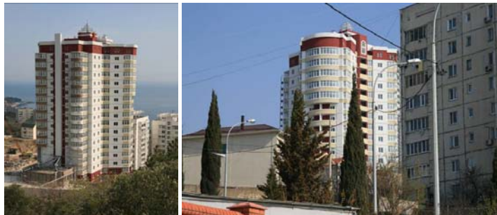
Стан робіт на об'єкті будівництва по вул. Южній, 64-66 (I черга), станом на 05.05.2009 р.