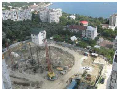
Стан робіт на об'єкті будівництва по вул. Южній, 64-66 (II черга), станом на кінець березня 2009 року