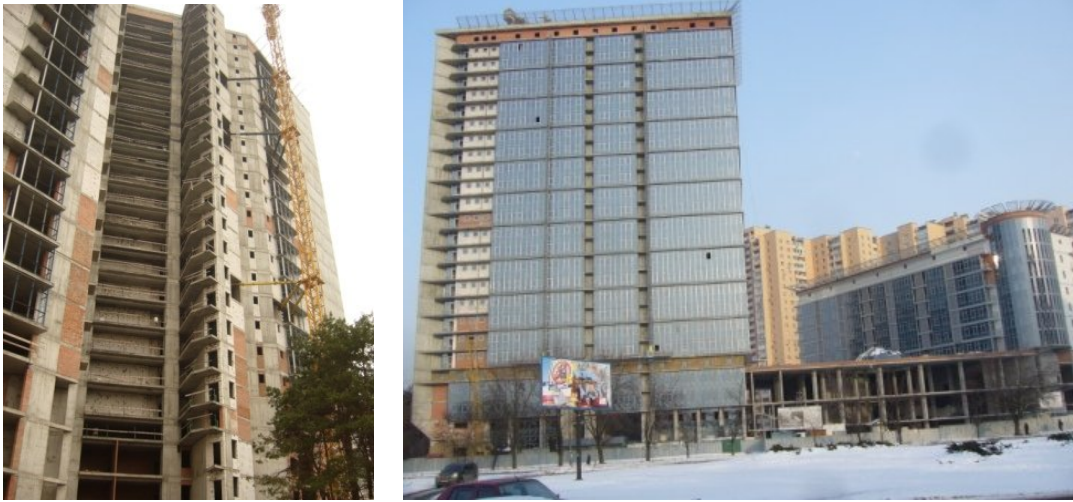
Рисунок 1. Будівельні роботи на об'єкті «Артеміда комплекс» за адресою м. Київ, перехрестя Дарницького бульвару та вул. Генерала Жмаченка станом на початок 2010 р.