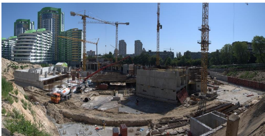
Стан будівництва II черги житлового комплексу по вул. Вишгородській, 45 у м. Києві у травні та липні 2010 року (зверху вниз)