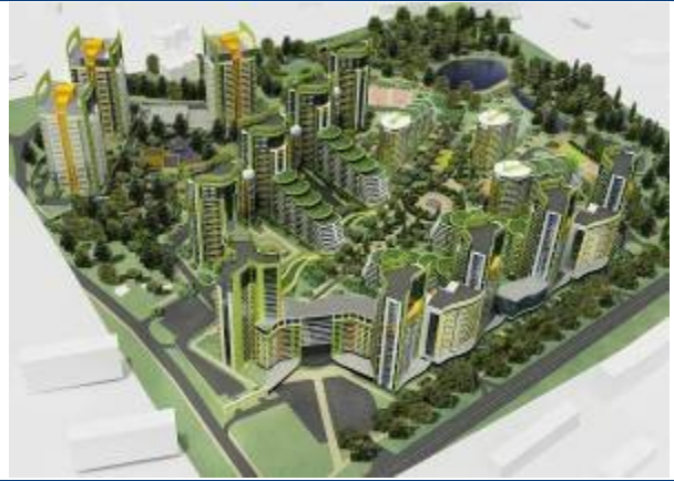
Макет житлового комплексу «Паркове місто» по вул. Вишгородській, 45 у м. Києві