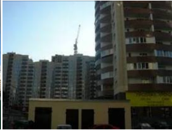
Секції 5-11 житлового будинку № 28