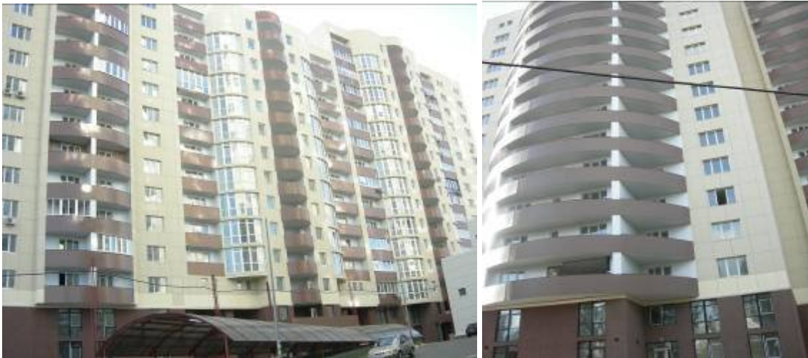
Секції 6-5, 6-6 та 6-7 житлового будинку № 6