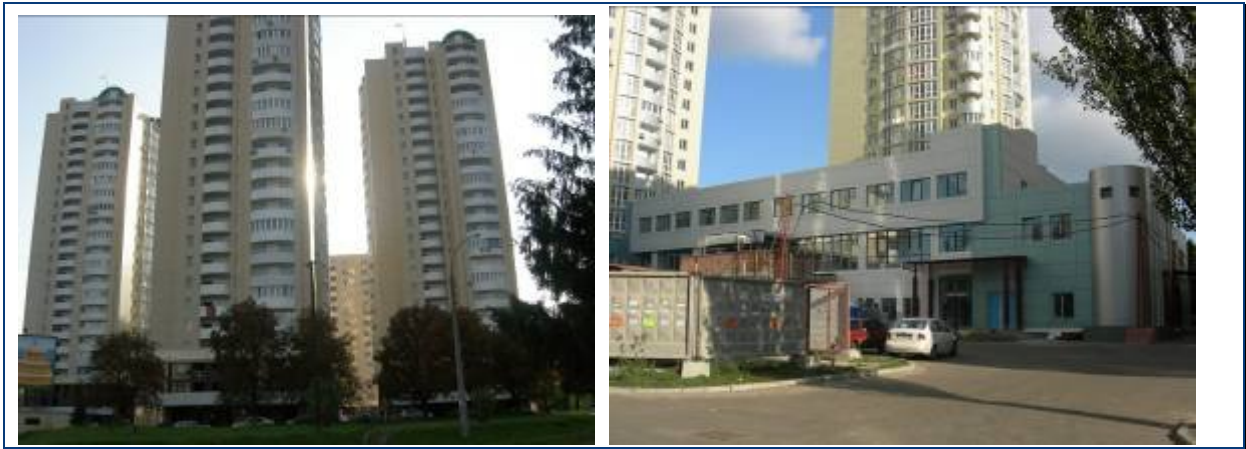
Житлові будинки №№ 1, 2, 3 та торговельний центр з паркінгом