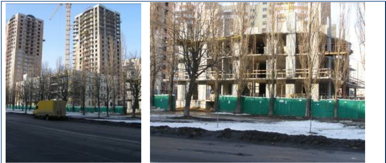
Будівельні роботи по житловим будинкам №№ 33 та 34 та № 35 станом на кінець березня 2010 року