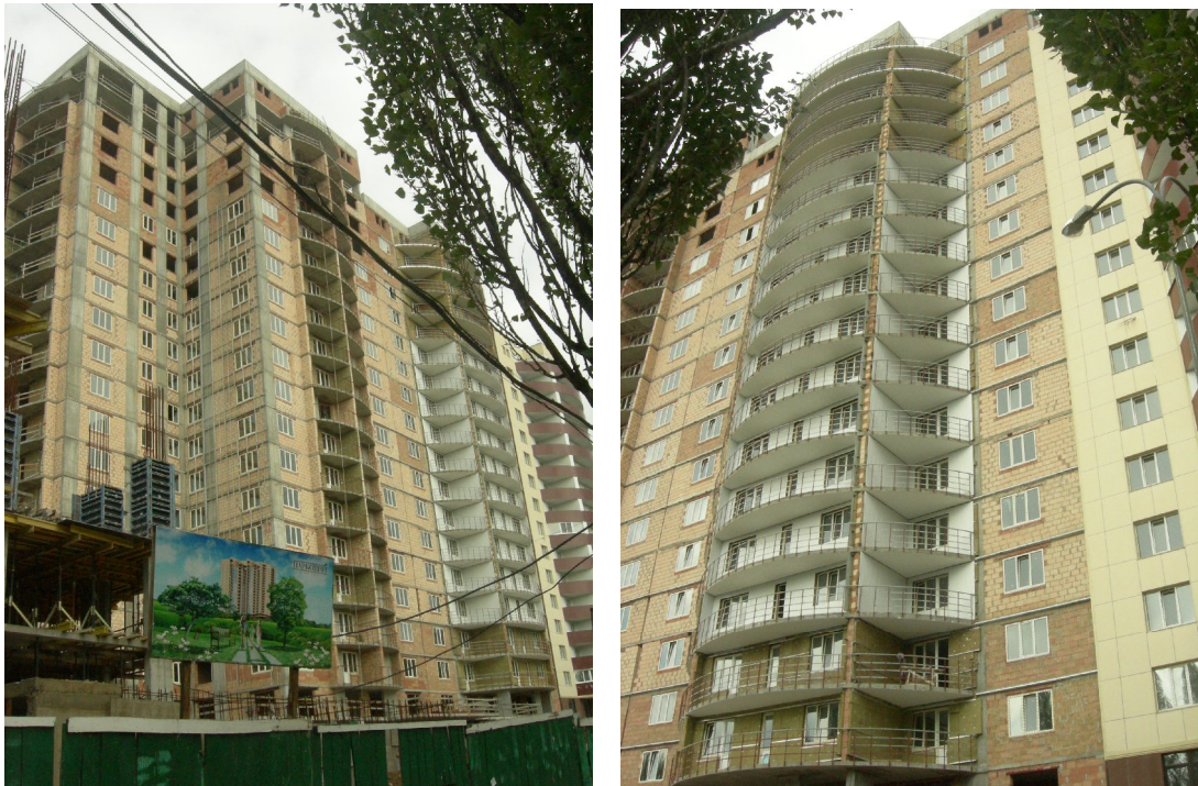
Будівельні роботи на секціях 2-3 житлового будинку № 26 станом на початок вересня 2010 року