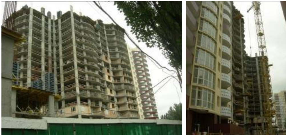
Будівельні роботи на секціях 1-3 житлового будинку № 26 станом на кінець травня 2010 року