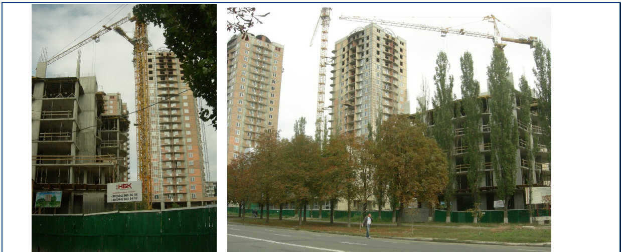
Будівельні роботи по житловим будинкам №№ 33 та 34 та № 35 станом на початок вересня 2010 року