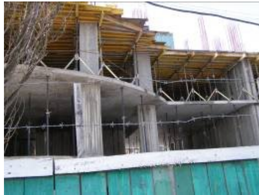
Будівельні роботи на секціях 1-4 житлового будинку № 28 станом на кінець березня 2010 року