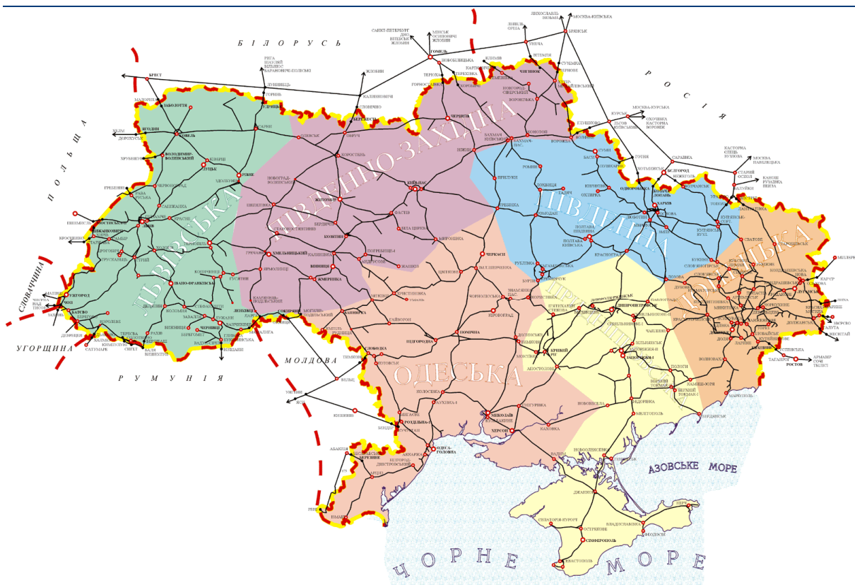
Рисунок 1. Карта залізниць України

ДП «Придніпровська залізниця» засновано на державній власності, входить до сфери управління Міністерства транспорту та зв'язку України і підпорядковано Державній адміністрації залізничного транспорту України (далі – «Укрзалізниця»), яку було створено згідно з Постановою КМУ № 356 від 14.12.1991 р. Відповідно до зазначеної Постанови у підпорядкуванні «Укрзалізниці» перебувають Донецька, Львівська, Одеська, Південна, Південно-Західна та Придніпровська залізниці (Рисунок 1), а також всі інші розташовані на території України підприємства, установи й організації, що були підпорядковані Міністерству шляхів СРСР. «Укрзалізниця» здійснює централізоване керування процесом перевезень у внутрішньому та міждержавному сполученнях, а також регулює виробничо-господарську діяльність залізниць.