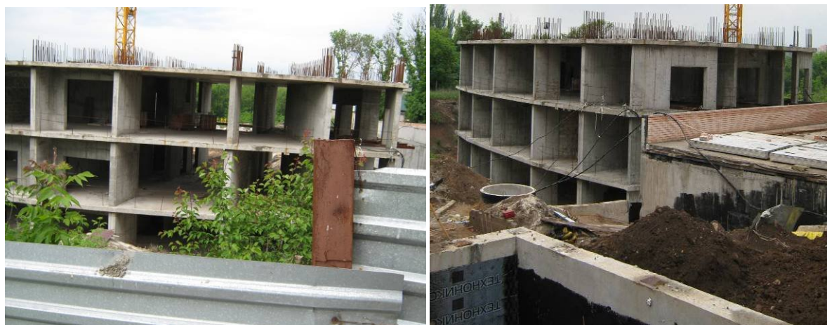
Будівництво житлового будинку №2 по пр. Панфілова у м. Донецьку станом на 29.05.2009 р.