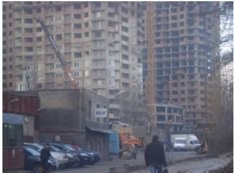
Будівельні роботи на об'єкті будівництва житлового комплексу по вул. Механізаторів, 2 (ж/к «Ізумрудний») у Солом'янському районі м. Києва станом на 21.11.2009 р.