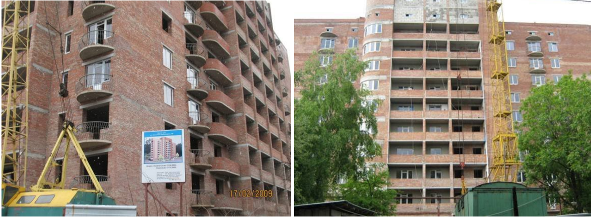
Стан будівництва житлового будинку по вул. Бакинських Комісарів, 100 у м. Донецьку станом на 17.02.2009 р. та станом на 29.05.2009 р.