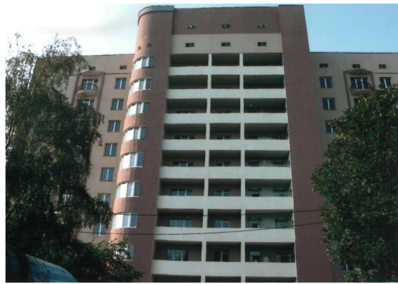
Стан будівництва житлового будинку по вул. Бакинських Комісарів, 100 у м. Донецьку станом на серпень 2010 р.