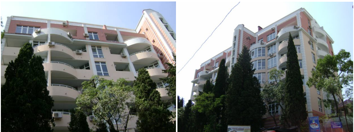
Рисунок 2.1. Фото рекреаційного комплексу для тривалого сімейного перебування по вул. Володарського у м. Ялті

Генпідрядником будівництва є ТОВ «Професіонал». Рекреаційний комплекс введено в експлуатацію у IV кварталі 2008 року (Акт введення в експлуатацію від 19.12.2008 р.).