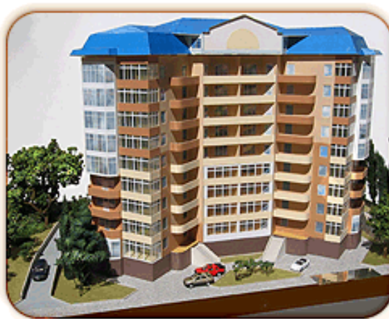
Рисунок 2.2. Макет рекреаційного комплексу по вул. Луговського в смт. Сімеїз

Зазначена земельна ділянка з півночі та сходу межує з територією санаторія «Сімеїз», з півночі – з територією санаторія «ім. Семашка» та морським узбережжям, що робить проект будівництва рекреаційного комплексу інвестиційно привабливим. Із заходу ділянка обмежена гирлом джерела та проїздом наявної забудови.