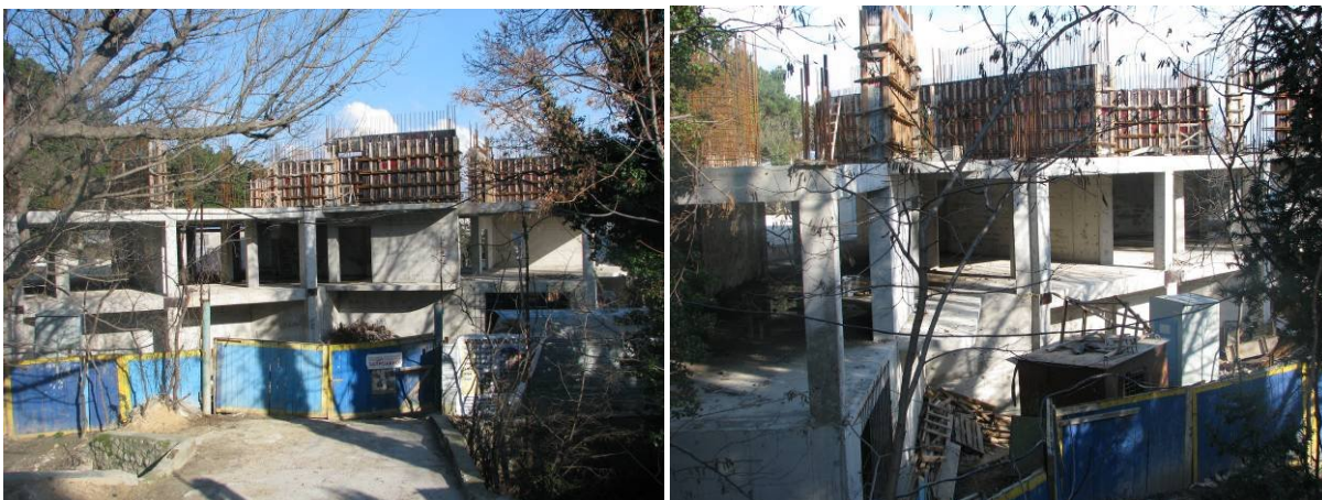
Рисунок 2.3. Хід будівництва рекреаційного комплексу по вул. Луговського в смт. Сімеїз станом на 20.02.2009 р.