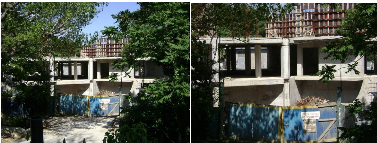
Рисунок 2.4. Хід будівництва рекреаційного комплексу по вул. Луговського в смт. Сімеїз станом на 04.06.2009 р.