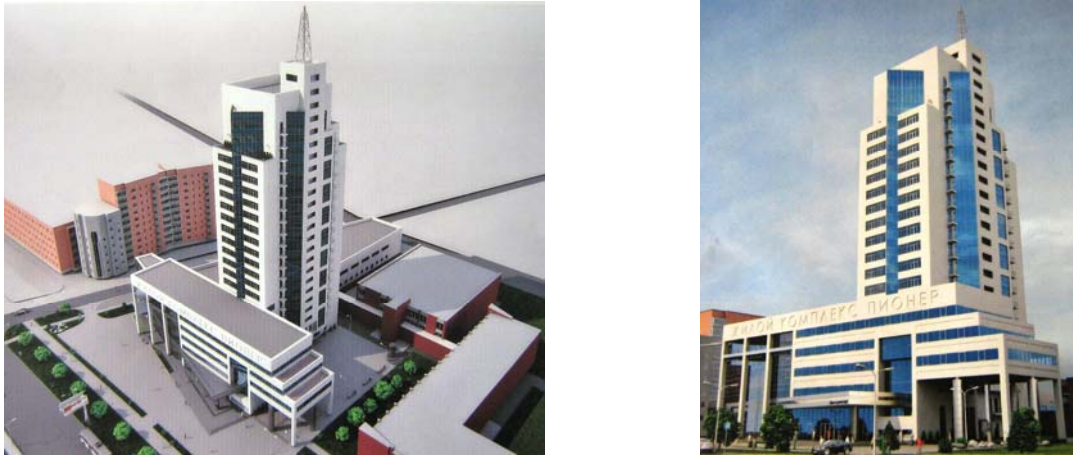
Рисунок 4.1. Макет житлового комплексу «Піонер»

Наразі компанія планує здійснити інвестування спорудження житлового комплексу з об'єктами громадського призначення «Піонер» по пр. Будівельників, 141-А у Жовтневому районі м. Маріуполя Донецької області (Рисунок 4.1).