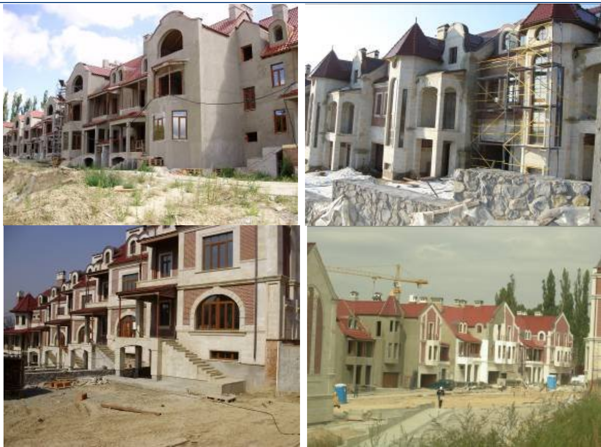
Рисунок Ошибка! Текст указанного стиля в документе отсутствует..1. Будівництво багатофункціонального торговельно-розважального комплексу з сервісними службами та індивідуальною житловою забудовою на вул. Метрологічній, 18 у м. Києві станом на вересень 2009 року, березень, травень та вересень 2010 року