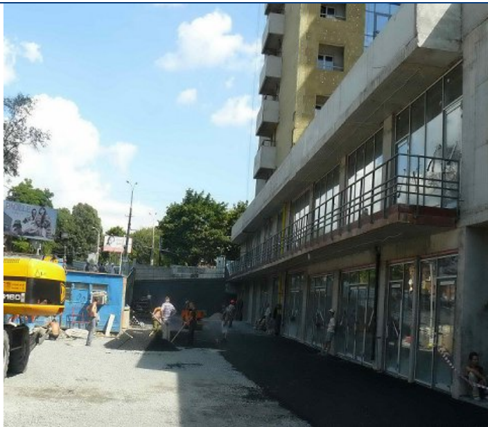
Хід робіт на об'єкті будівництва по вул. Ульянова, в районі буд. 17 А у м. Дніпропетровську станом на 10.08.2009 р.