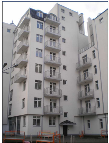
Хід будівництва групи багатоквартирних житлових будинків по вул. Червоноармійській, 43 в у м. Чернівцях станом на початок вересня 2014 року