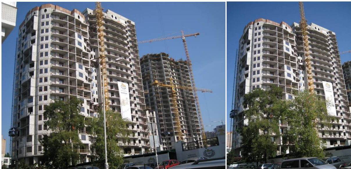
Будівництво житлово-офісного комплексу з вбудованими, прибудованими приміщеннями та підземним паркінгом по вул. Анрі Барбюса, 37/1 у Печерському районі м. Києва станом на 23.09.2009 р.