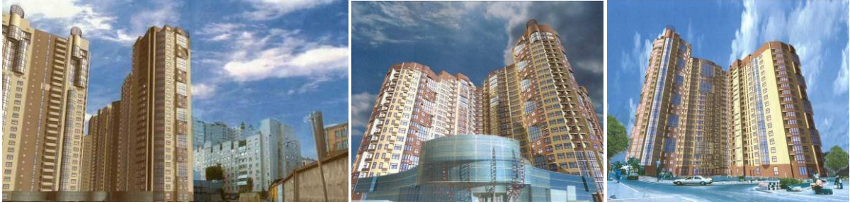
Макет житлово-офісного комплексу з вбудованими, прибудованими приміщеннями та підземним паркінгом по вул. Анрі Барбюса, 37/1 у Печерському районі м. Києва