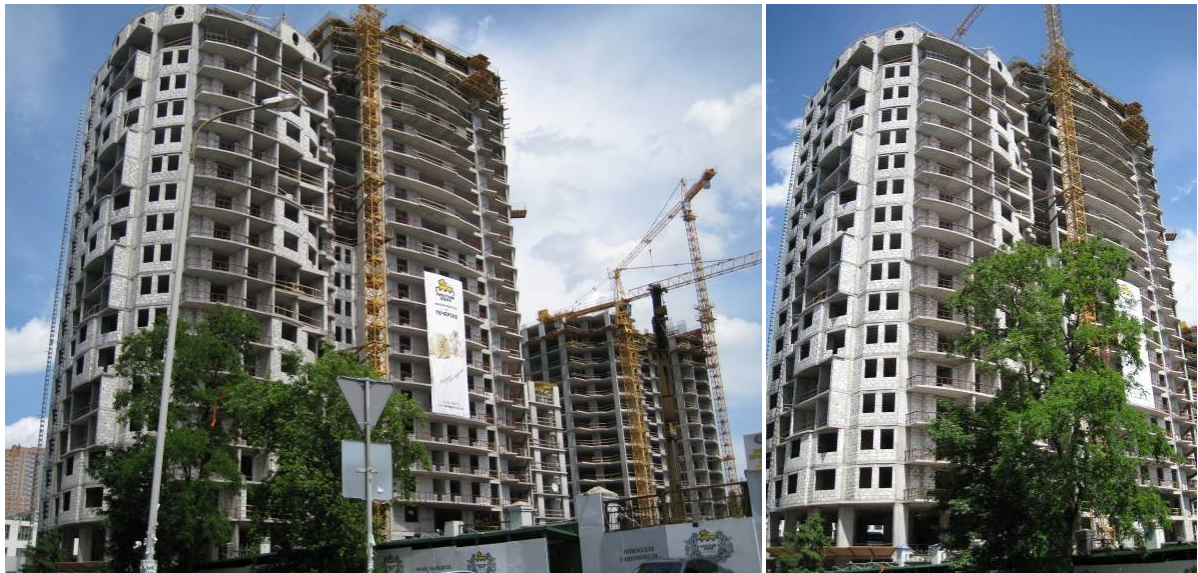
Будівництво житлово-офісного комплексу з вбудованими, прибудованими приміщеннями та підземним паркінгом по вул. Анрі Барбюса, 37/1 у Печерському районі м. Києва станом на 08.06.2009 р.