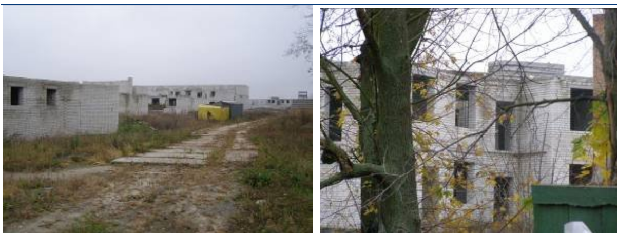
Рисунок 3. Об'єкт незавершеного будівництва - житловий комплекс з об'єктами соціально-побутової інфраструктури по вул. Леніна, 119 у с. Петропавлівська Борщагівка Києво-Святошинського району Київської області станом на кінець 2010 року