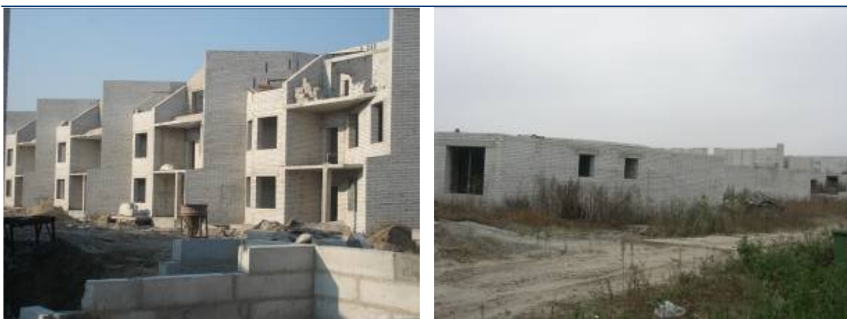
Рисунок 2. Хід будівництва житлового комплексу з об'єктами соціально-побутової інфраструктури по вул. Леніна, 119 у с. Петропавлівська Борщагівка Києво-Святошинського району Київської області станом на кінець квітня 2009 року та на листопад 2009 року.