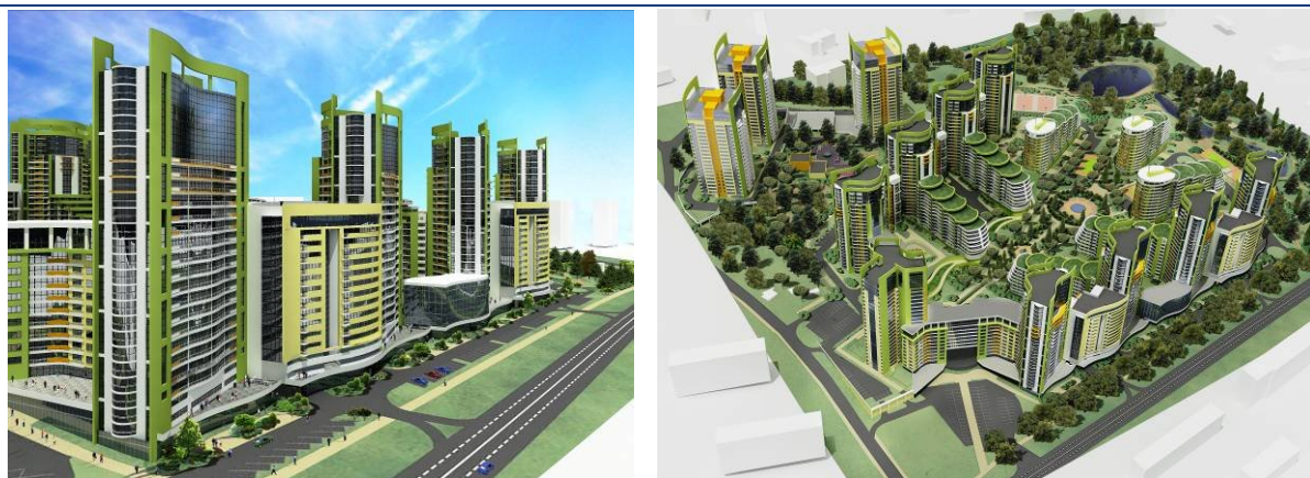
Макет житлового комплексу «Кристерова гірка» по вул. Вишгородській, 45 у м. Києві