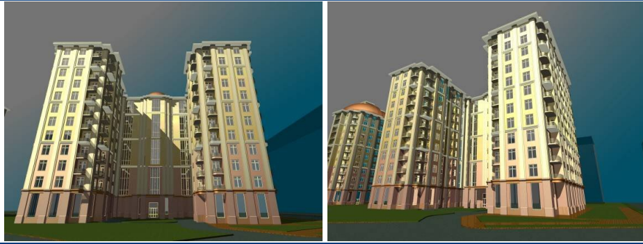
Макет багатоповерхового житлового будинку з вбудованими офісними приміщеннями та підземними автостоянками на пр. В. Чорновола – вул. П. Панча в м. Львові