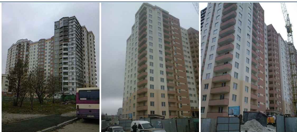
Хід будівництва багатоповерхового житлового будинку з вбудованими офісними приміщеннями та підземними автостоянками по вул. Панча, 18-б у м. Львові станом на грудень 2009 року

Станом на 30.09.2009 р. фінансові зобов'язання ТОВ «БК «Нове місто» представлено заборгованістю за банківськими кредитами на суму 30 402 тис. грн. (на 4,3% більше, ніж на початок року). Більше 80% заборгованості номіновано в іноземній валюті. Крім того, підприємство здійснило випуск цільових облігацій серій А-С номінальним обсягом 49 750 тис. грн. з метою випуску фінансування будівництва багатоповерхового житлового будинку з вбудованими офісними приміщеннями та підземними автостоянками на пр. В. Чорновола – вул. П. Панча в м. Львові. Облігації було розміщено повністю.