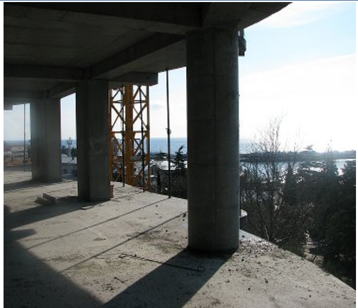
Будівництво багатоповерхового житлового будинку по вул. К. Маркса, 18а у м. Ялті станом на 04.06.2009 р.