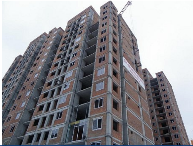
Хід робіт на об'єкті будівництва по пров. Ламаному в м. Дніпропетровську станом на 13.12.2010 р.