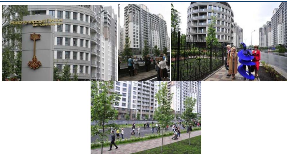
Житловий квартал по вул. Професора Підвисоцького у Печерському районі м. Києва (I черги будівництва)