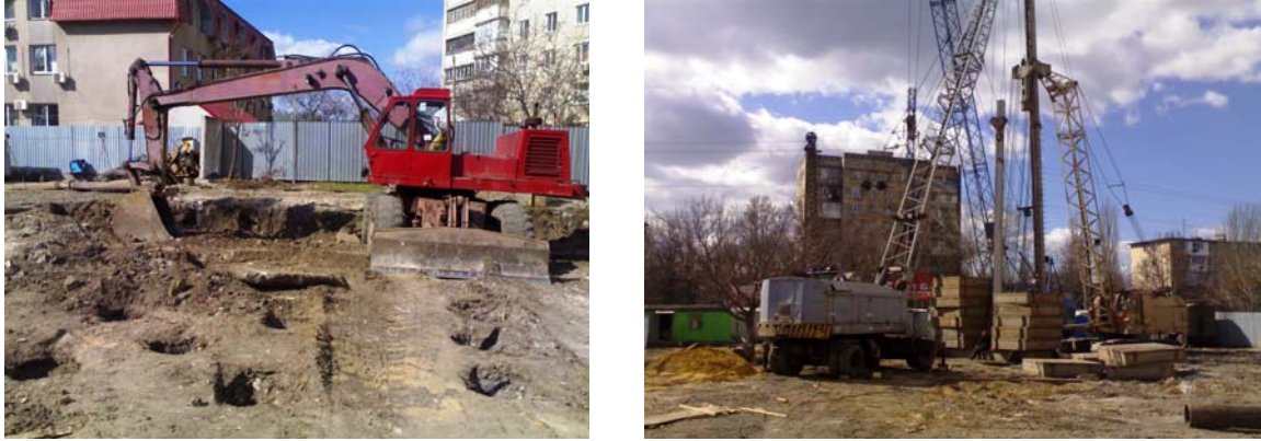
Рисунок 2.4. Хід робіт на об'єкті будівництва по вул. Малиновського (в межах вул. Заводської та пров. Союзного) у м. Одесі станом на 11.03.2008 р.

Орієнтовний строк закінчення будівництва та введення будинку в експлуатацію, згідно з календарним планом виконання та фінансування, – грудень 2009 року (Додаток № 4).