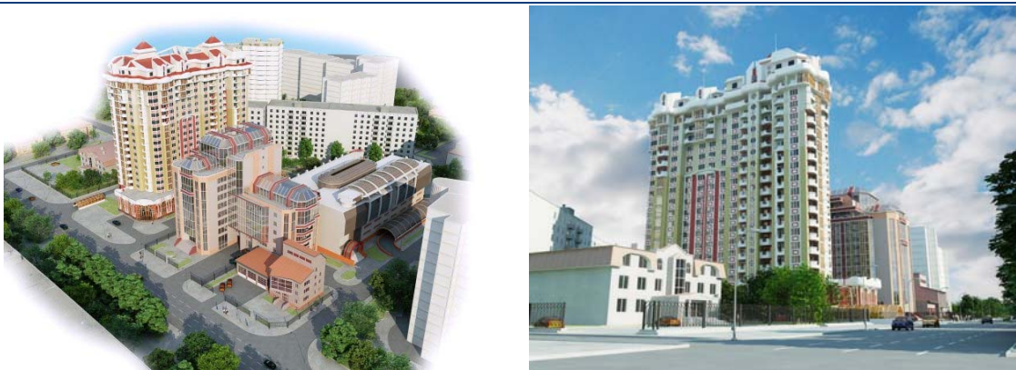
Рисунок 2.3. Макет житлового будинку по вул. Малиновського (в межах вул. Заводської та пров. Союзного) у м. Одесі

ТОВ «ГРАНІ» на правах Замовника та Інвестора здійснює реалізацію проекту будівництва житлового будинку з вбудовано-прибудованими приміщеннями та підземним паркінгом по вул. Малиновського (в межах пров. Союзного та вул. Заводської) у м. Одесі (Рисунок 2.3).