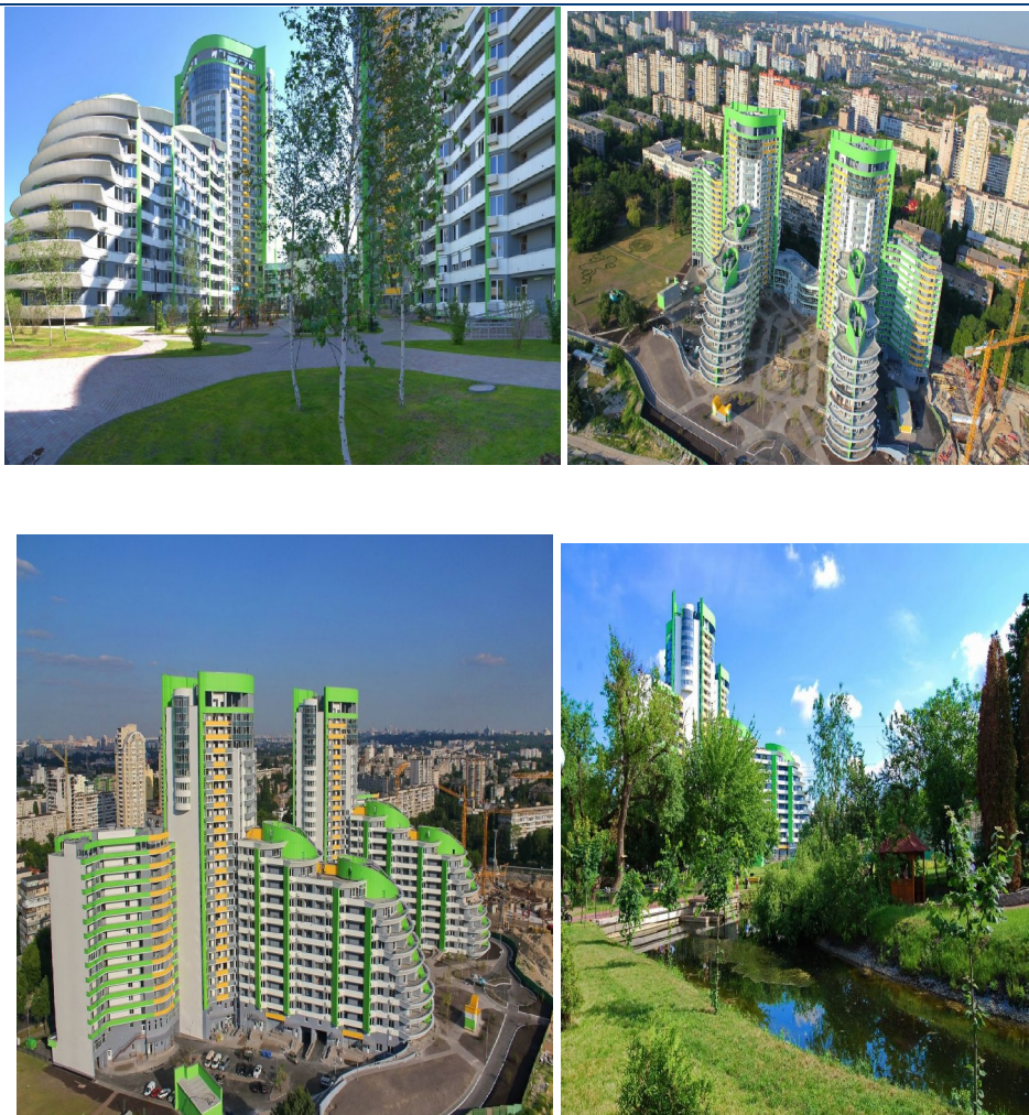
Рисунок 1. Житловий комплекс «Паркове місто» (I черга) по вул. Вишгородській, 45 у м. Києві