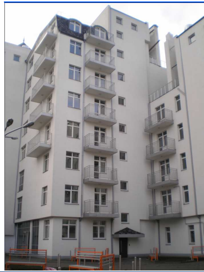
Хід будівництва групи багатоквартирних житлових будинків по вул. Червоноармійській, 43 в у м. Чернівцях станом на початок вересня 2014 року