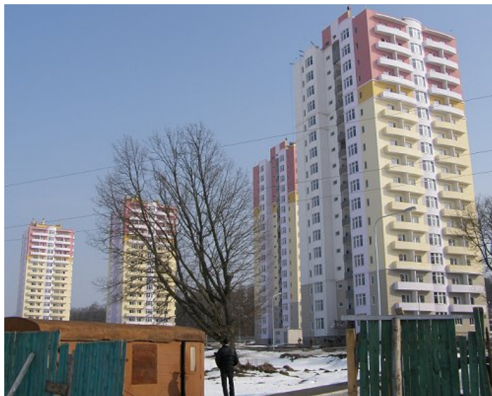
Стан будівництва житлового комплексу Grand Life в м. Ірпені Київської області станом на 19.03.2010 р.