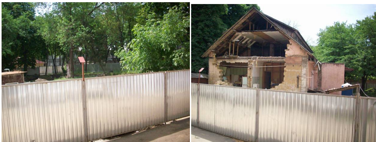
Фото земельної ділянки під будівництво житлового будинку по Французькому бульвару, 13-А в м. Одесі станом на 29.05.2009 р.