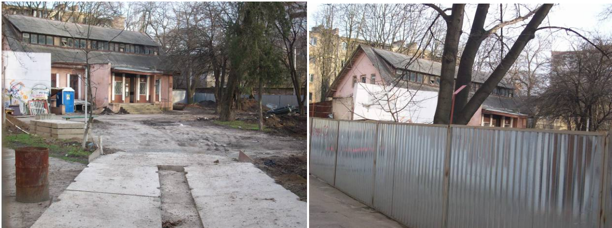
Фото земельної ділянки під будівництво житлового будинку по Французькому бульвару, 13-А в м. Одесі станом на 20.02.2009 р.