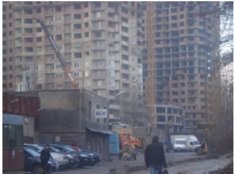
Рисунок 1.2. Будівельні роботи на об'єкті будівництва житлового комплексу по вул. Механізаторів, 2 (ж/к «Ізумрудний») у Солом'янському районі м. Києва станом на 21.11.2009 р.