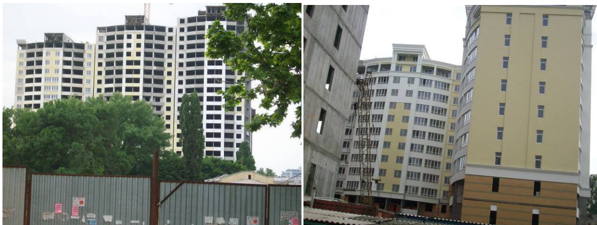
Будівництво житлового комплексу вул. Армійській, 11 станом на 29.05.2009 р.