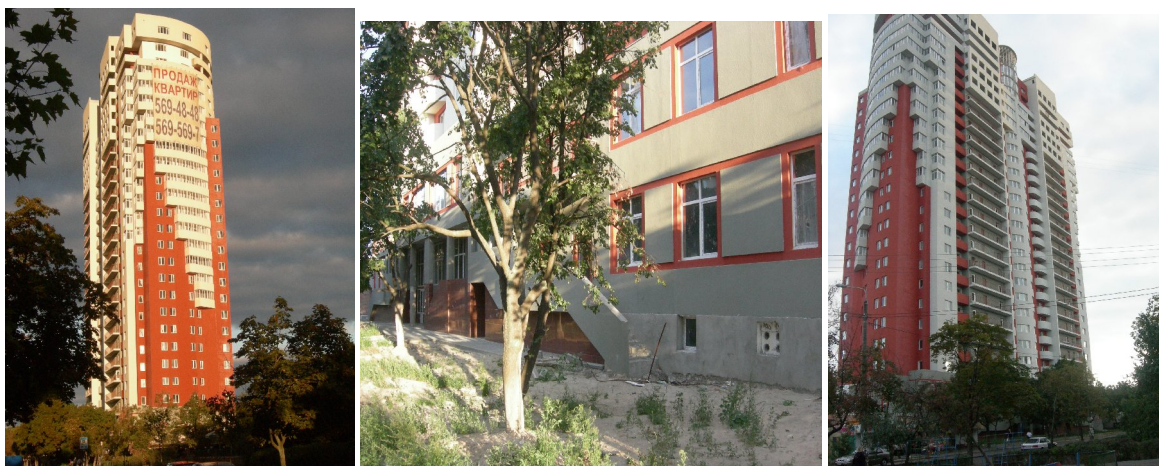
Об'єкт будівництва по вул. П. Запорозця, 26-А станом на вересень 2009 року