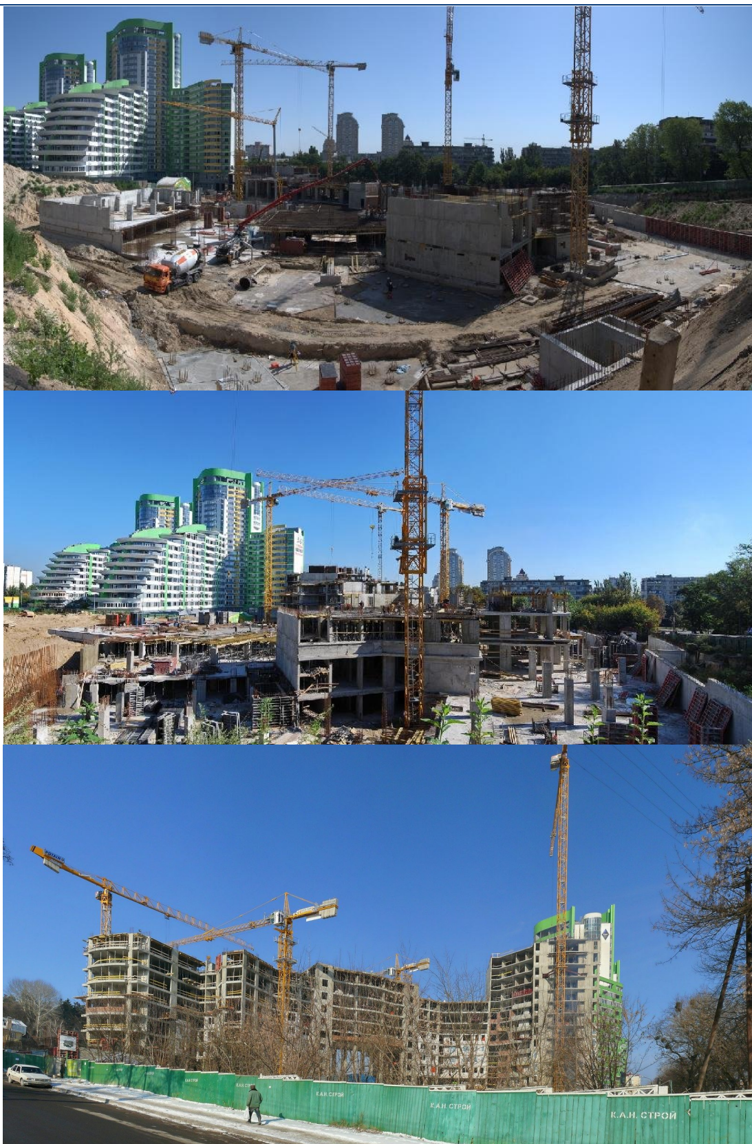
Стан будівництва II черги житлового комплексу по вул. Вишгородській, 45 у м. Києві у липні, вересні 2010 року та лютому 2011 року (зверху вниз)