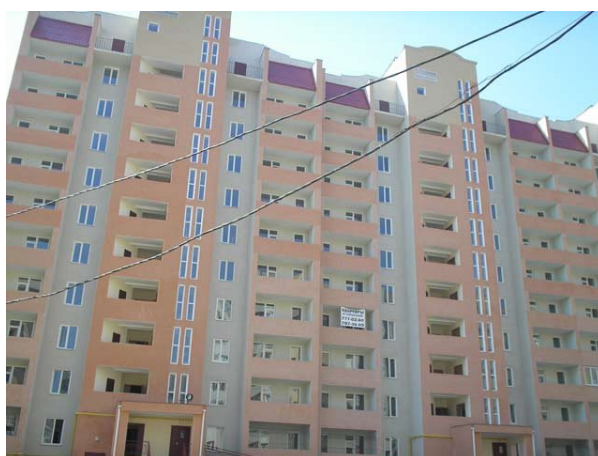
Рисунок 4. Житловий будинок № 81 у мікрорайоні «Д» Південний у м. Одесі.