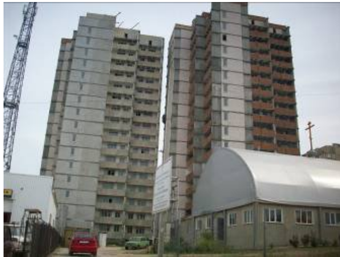
Рисунок 1. Стан будівельної готовності житлових будинків № 1 та № 1А у мікрорайоні III-4-1 Котовського у м. Одесі станом на кінець вересня 2009 р.