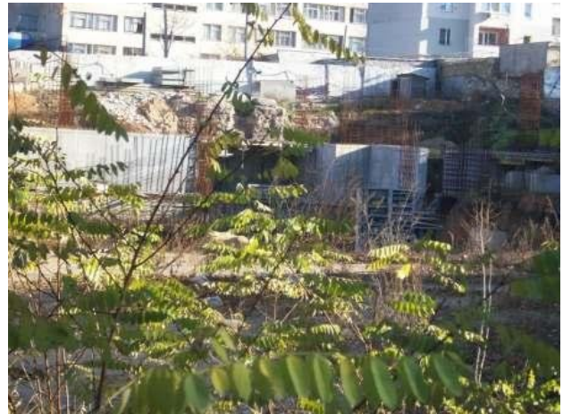
Рисунок 2. Стан будівельної готовності житлових будинків по вул. Головікській, 5, 7 у м. Одесі станом 07.09.2009 р. та 30.11.2009 р. (зліва направо)