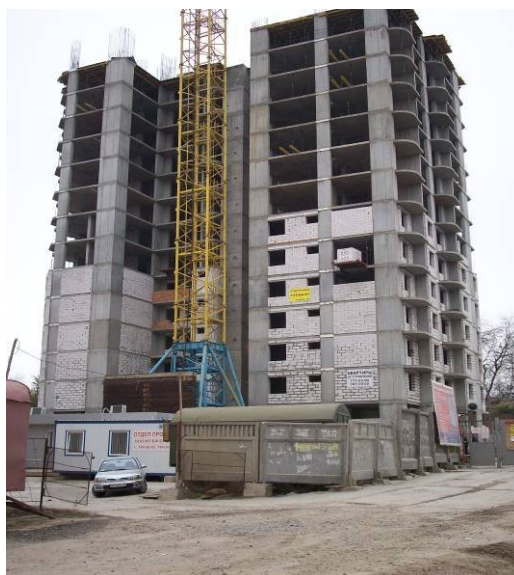
Рисунок 3. Стан будівельної готовності житлового будинку № 36 у мікрорайоні «Д» Південний у м. Одесі