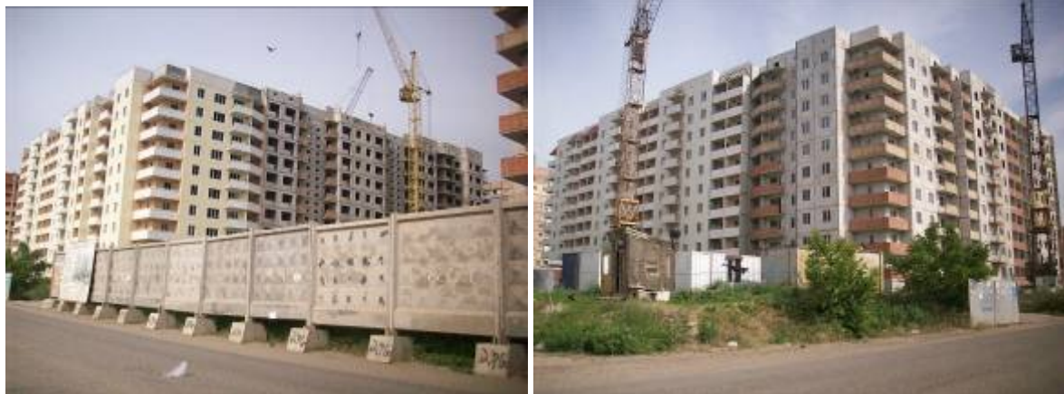
Рисунок 5. Стан будівельної готовності житлового будинку № 19 та №20 у мікрорайоні III-4-3 Котовського у м. Одесі станом на 30.05.2009 р.