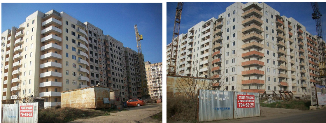
Рисунок 6. Стан будівельної готовності житлового будинку №19 та №20 у мікрорайоні III-4-3 Котовського у м. Одесі станом на 30.11.2009 р.