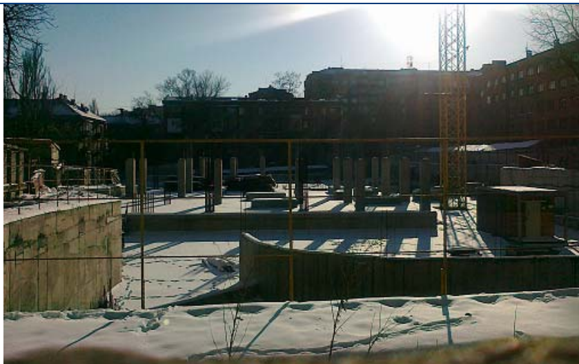
Хід робіт з будівництва багатоповерхового житлового будинку з вбудовано-прибудованими приміщеннями громадського призначення та підземного паркінгу по вул. Білоруській, 36-а у Шевченківському районі м. Києва станом на 01.03.2011 р.