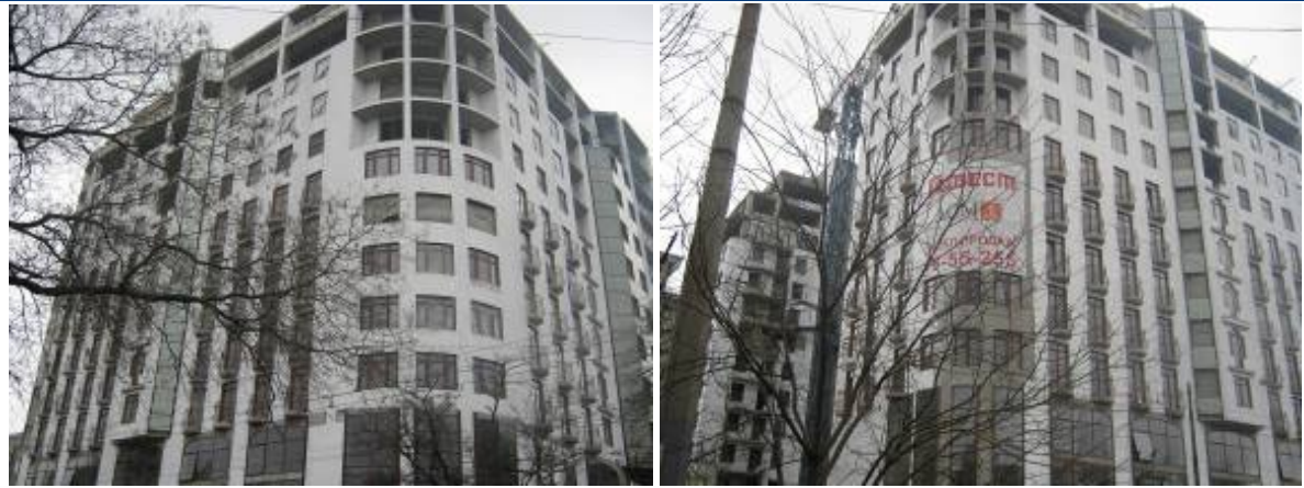
Хід будівництва житлово-торговельного комплексу по вул. Грецькій, 1 у м. Одесі станом на початок квітня 2010 року