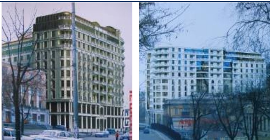
Макет житлово-торговельного комплексу по вул. Грецькій, 1 у м. Одесі

Фінансові зобов'язання ПТП «ГЕФЕСТ» станом на 31.03.2010 р. представлено заборгованістю за кредитом на суму 87 991 тис. грн. Крім того, підприємство здійснило випуск цільових облігацій серії А номінальним обсягом 50 500 тис. грн. з метою фінансування будівництва житлово-торговельного комплексу по вул. Грецькій, 1, у м. Одесі. При погашенні одна облігація дає право на отримання 0,01 кв. м загальної площі квартири у зазначеному житловому комплексі. ПТП «ГЕФЕСТ» розмістило облігації у повному обсязі. Під час погашення, яке мало закінчитися 02.12.2010 р., облігації було погашено неповністю через затримки в оформленні документів із власниками. Емітентом подано звіт про наслідки погашення облігацій до ДКЦПФР.