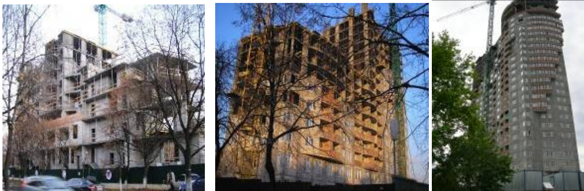
Хід робіт на об'єкті будівництва по вул. П. Запорожця, 26-А станом на (зліва - направо) початок листопада 2007 року, початок лютого 2008 року, початок травня 2008 року.