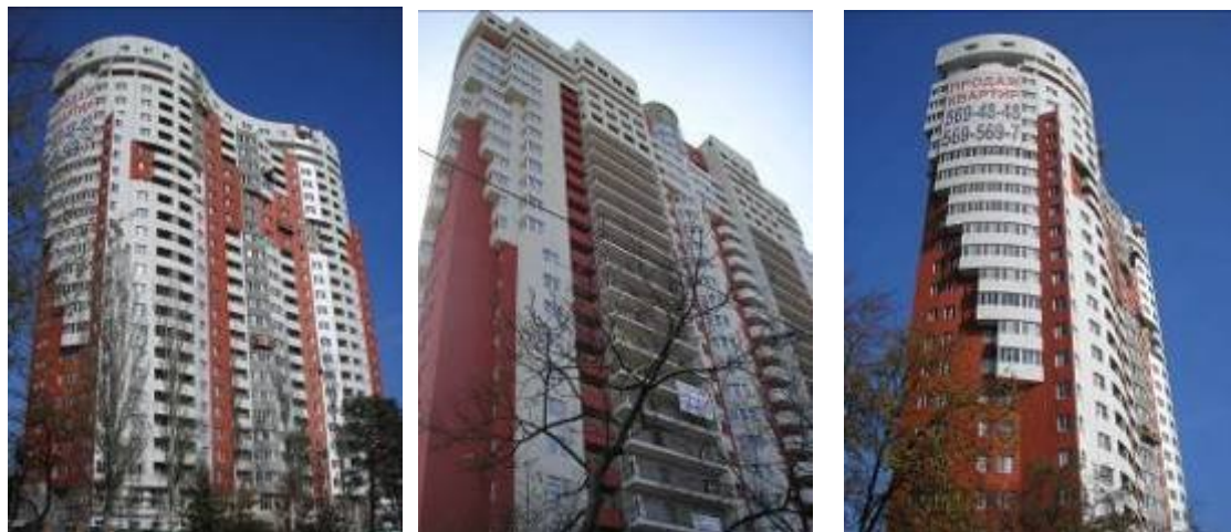
Хід робіт на об'єкті будівництва по вул. П. Запорожця, 26-А станом на кінець жовтня 2008 року.